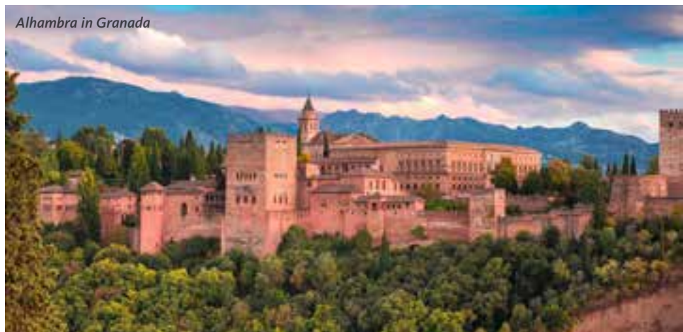
Alhambra in Granada

Wir fahren in die idyllische Bergwelt nach Ronda, eine der ältesten Städte Spaniens. Hier hat sich die Natur etwas Besonderes einfallen lassen. Eine tiefe Schlucht trennt die Neustadt von der pittoresken Altstadt, die durch eine imposante Brücke verbunden sind. Die spezielle Lage Rondas über der Schlucht des Tajo begeistert jeden Besucher. Während eines Rundganges durch die ruhigen Gassen besuchen wir ein typisch andalusisches Wohnhaus und die Stierkampfarena.