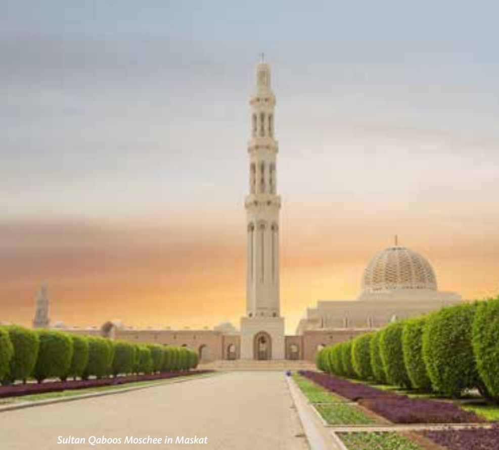
Sultan Qaboos Moschee in Maskat