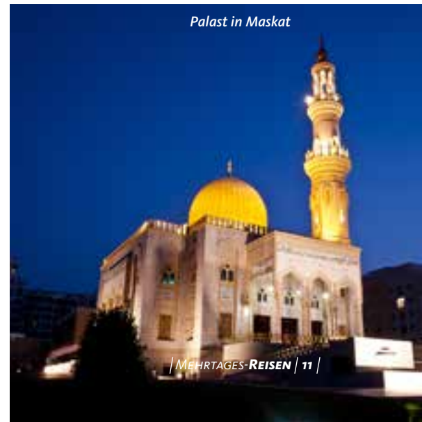
Palast in Maskat

Zeit für unser nächstes Geländewagen-Abenteuer! Die Fahrt geht auf zum Teil pistenähnlicher Strecke Richtung Sur. Entlang des Weges münden zahlreiche Wadis in den Indischen Ozean, von denen das Wadi Arbeyn und das Wadi Tiwi zu den schönsten des Landes gehören. Auf dieser landschaftlich reizvollen Fahrt ist der Weg das Ziel. Unterwegs genießen wir ein Picknick. Hier erfahren wir Interessantes über Natur, Land und Leute. ▶